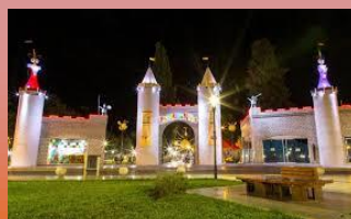
PARQUE DE LOS NIÑOS